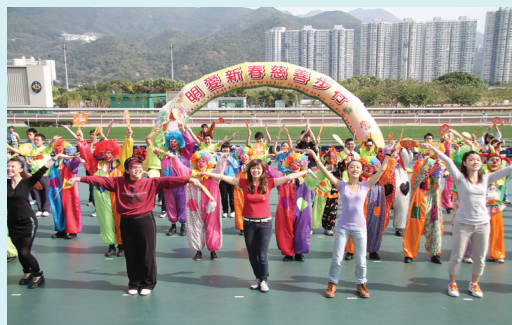
二零一一年明愛新春慈善步行 — 萬眾一心、全情投入「同心同行活力操」